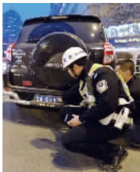
防撞杆挡住了这辆车的号牌

韶两句 24小时读者热线: 96060 都市圈网www.dsqq.cn E-mail: xdkb@kuaibao.net