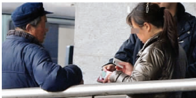
南京火车站前,票贩正在“做生意”