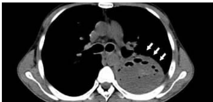
箭头所示为左下肺的脓腔