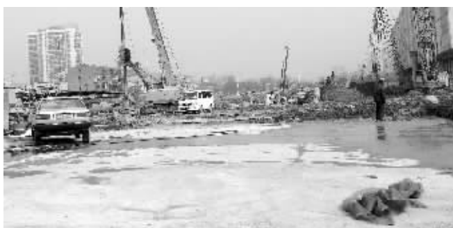
金盛建材楼工地仍在施工

工地上位一位知情人表示,施工方前一段时间往外运了三天的渣土,结果把路面搞得一塌糊涂。就拿进出道路来说,曝光这么多天了,也不组织人清洗一下。另外洗车台问题也没解决,就搞个小水枪在临时顶一下。停工已发了好几天了,为什么停不下来?他认为,这和监理单位也有关系,监理单位是有权下发停工令的,可是从目前现状看,施工一直在持续。