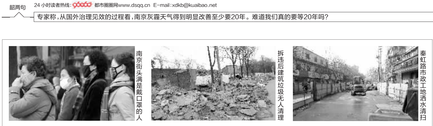
南京街头满是戴口罩的人