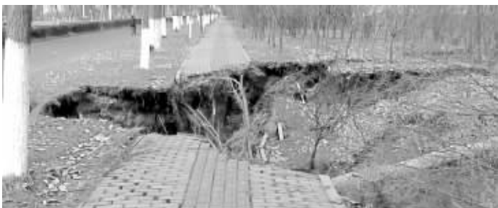
扬州扬子江南路人行道塌陷