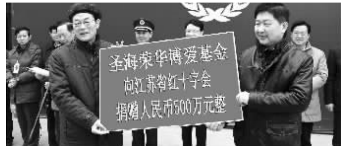
省政协常委、爱心企业家孙达华(右)代表圣海荣华公司捐款

快报讯(通讯员 江建宁)1月30日,江苏省红十字会接收到江苏圣海荣华旅游文化开发有限公司500万元捐款,这也是省红十字会新年收到的最大一笔捐款。省红十字会会长吴瑞林接受了捐款,并向爱心企业家孙达华颁发了荣誉证书和铜牌。