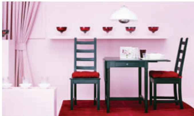
当年夜饭准备完毕,你要做的,就是好好招待全家人舒舒服服享用一顿美味的团圆饭,让彼此的欢声笑语停留此刻!

人们所谓的“年味儿”,除了团圆饭的“饭香味”,家居装饰上的“喜味儿”和“暖味儿”也是非常重要的。传统的吉祥图案和中国红为家里增