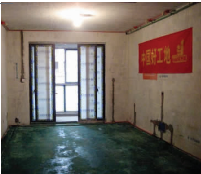
面对面装饰向广大业主开放在施工地