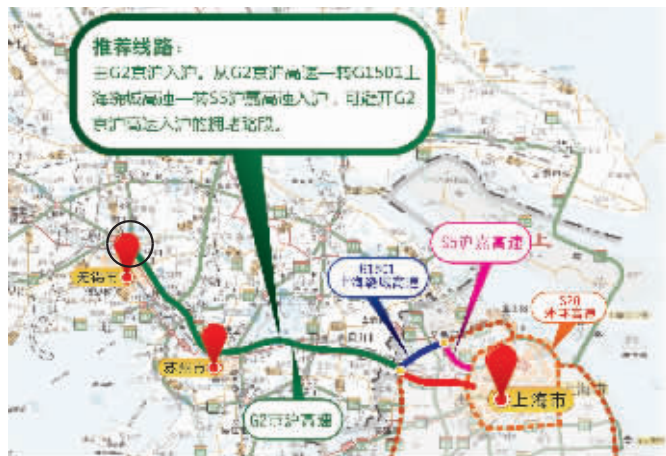
由画圈处进入G2转入S5沪嘉高速进入上海

第二条推荐线路是针对通过G50沪渝高速入沪的市民,到达沈海高速后,可以绕行,以避开G50沪渝高速入沪的拥堵路段:从G50沪渝高速—转G15沈海高速—转崧泽高架—转嘉闵高架—转北翟高架入沪。