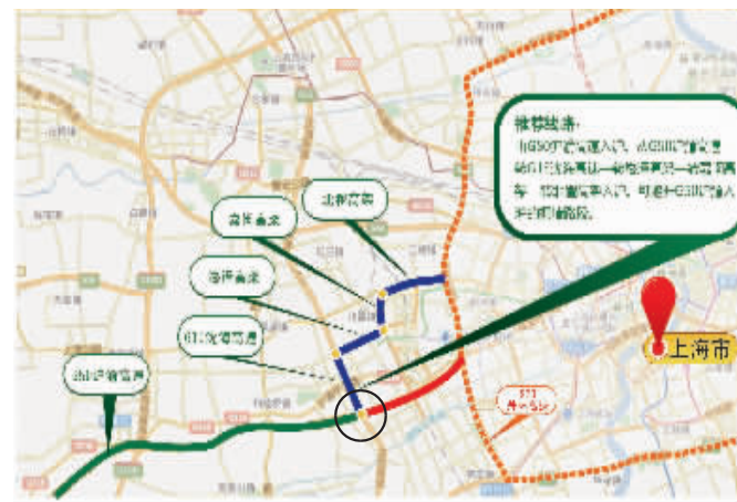
由G50前往上海到画圈处转入嘉闵高架

交警推荐,市民可以通过S58(S26)沪常高速转S83无锡支线,转S19通锡高速,从新安互通下高速进市区,约100公里,用时仅1小时左右。