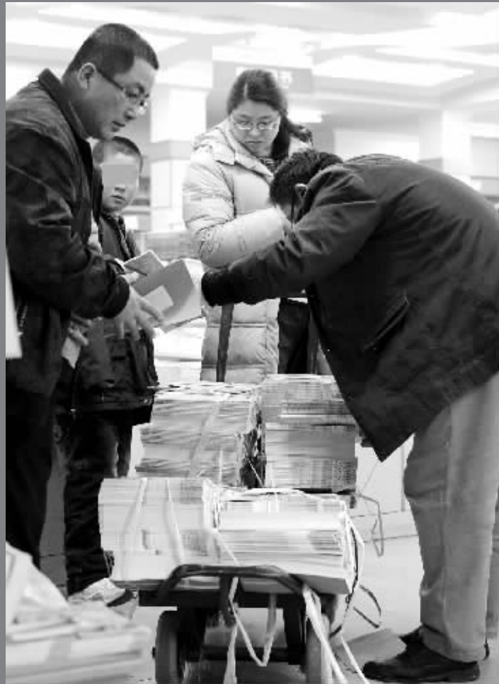
教材还没上架,家长已经“盯牢”了