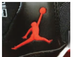
总觉得有点不对劲