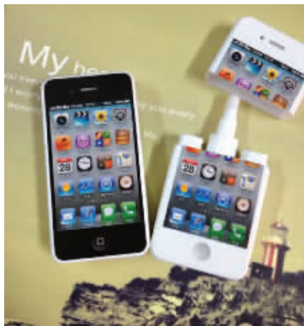
看上去是手机,其实是改正液