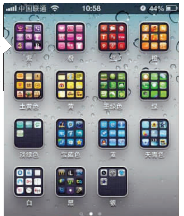
一个强迫症患者的手机