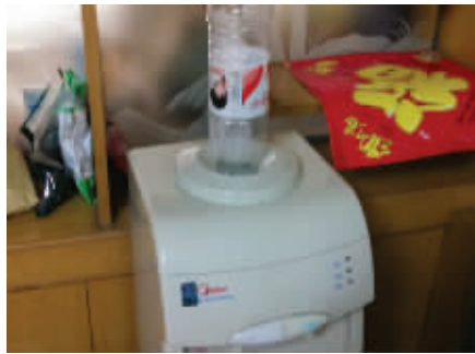
小身材,也有大追求