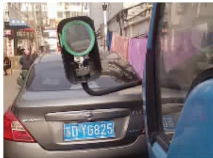
再也不心疼后视镜被撞了