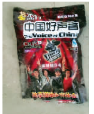
好声音终于被山寨了