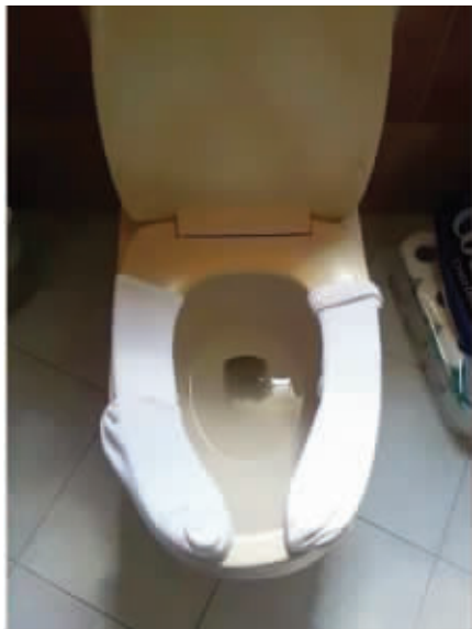
持家讲究的是节约