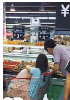
这个妹子哪里买的