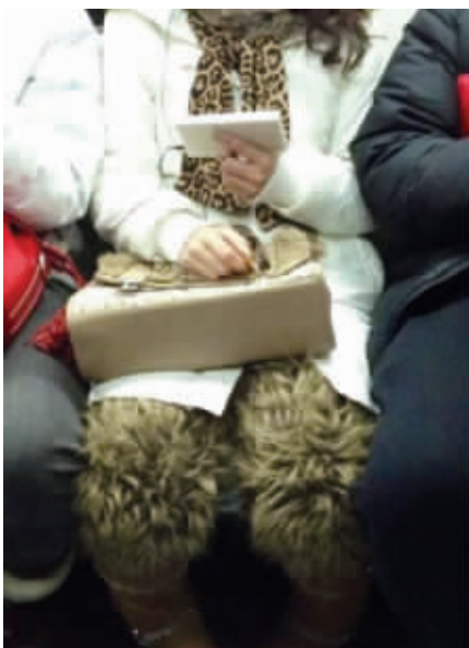
姑娘,你的腿毛好御寒