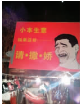
暴走漫画走进夜市