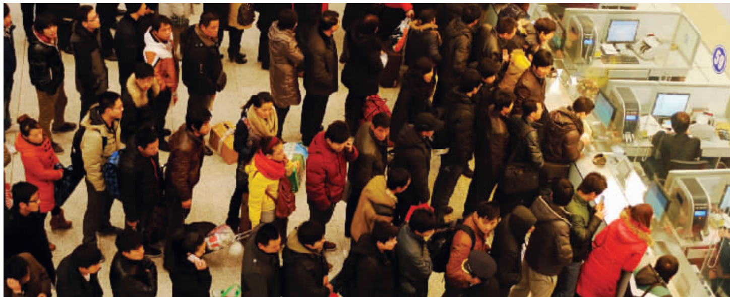
虽然网络、电话购票相对比较方便,但还是有不少人选择排队购票

1月26日,一年一度的春运就将正式拉开帷幕。为什么回家的火车票那么难买?为什么网上售票、电话订票要比窗口购票提前2天……昨天,铁道部运输局营运部副主任卫瑞明、铁道部公安局治安管理处处长王洪生、中国铁道科学研究院电子计算技术研究所副所长朱建生做客新华网,与网友们进行了交流。