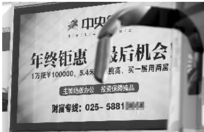
广告“造词”