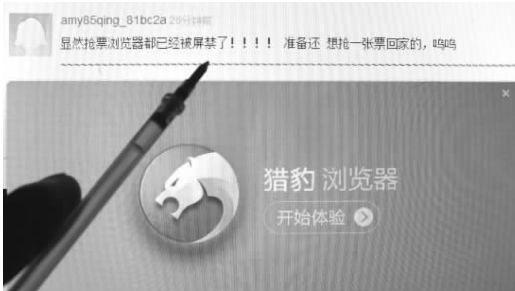
昨天,一位网民浏览金山猎豹浏览器抢票,发现已经不能使用,于是发表评论