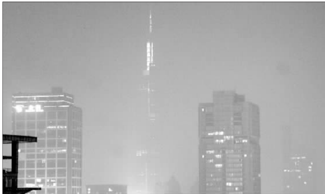
昨天傍晚, 南京城雾蒙蒙, 紫峰大厦若隐若现