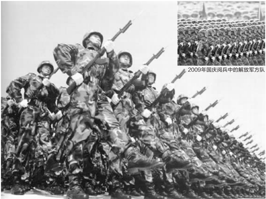
2009年国庆阅兵中的解放军方阵 1999年国庆阅兵中的解放军方阵 本版均为资料图片

第四阶段是1995年百万大裁军,共撤销8个军; 第三阶段是1997年50万大裁军,撤销2个军;