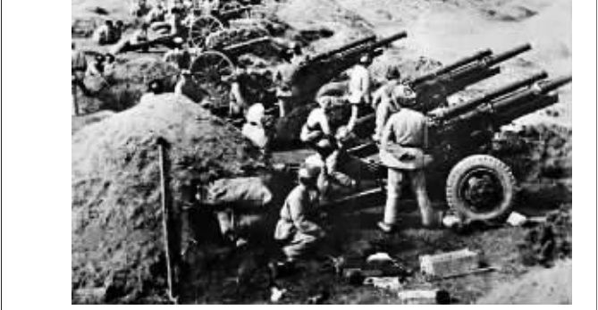
1948年,辽沈战役中的解放军炮兵群