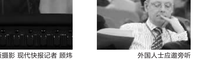
外国人士应邀旁听