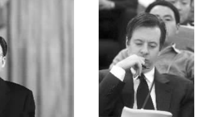
省长李学勇作政府工作报告