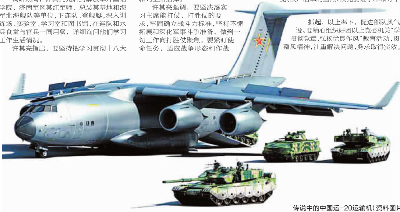
传说中的中国运-20运输机(资料图片)

抓起,以上率下,促进部队风气建设。要精心组织好团以上党委机关“学习贯彻党章、弘扬优良作风”教育活动,贯彻整风精神,注重解决问题,务求取得实效。