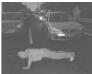
去年国庆堵车,有人做俯卧撑

@度假联盟-东游西逛乐得逍遥: 太应当了,而且应当提前二到三天。便民就应当落到实处,其实这个规定的制定者也可能是具体的受益者,咋就不人性化呢?