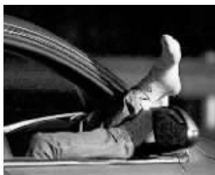
还有人就地睡觉 资料图