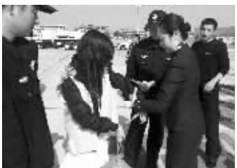
嫌犯上飞机前接受安检

随同民警押解嫌疑人的,还有4名柬埔寨民警,他们同样对电信诈骗深恶痛绝。4人都是第一次到中国,显得很兴奋,其中一位20多岁的柬埔寨民警告诉我,他参与了捣毁电信诈骗窝点的行动,现场的情景让他震惊,柬埔寨也有人受骗,所以他出手时毫不手软。这次到中国,是向江苏警方取经的。