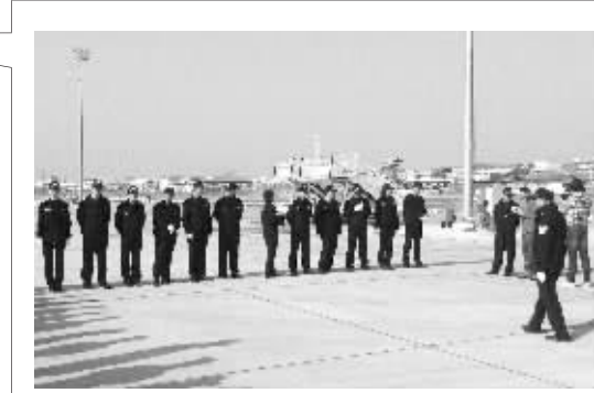
民警列队等待东方移交嫌犯

“最高笑的是,这些不法分子为了节约成本,竟然将一个键盘锯成三段,这样就能同时给三个人用。”民警说,这些键盘是骗子为了在电话中制造“电脑敲击敲击键盘声音”假象而配备的。