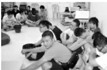
抓获的部分犯罪嫌疑人

几个东方工作人员不断地打着电话,很忙碌。10点左右,十来辆汽车从机场的小门开了进来,上面下来的人坐到了摆渡车上。“估计那辆车就是移送嫌疑人的。”早已整装等待的民警都摩拳擦掌起来。