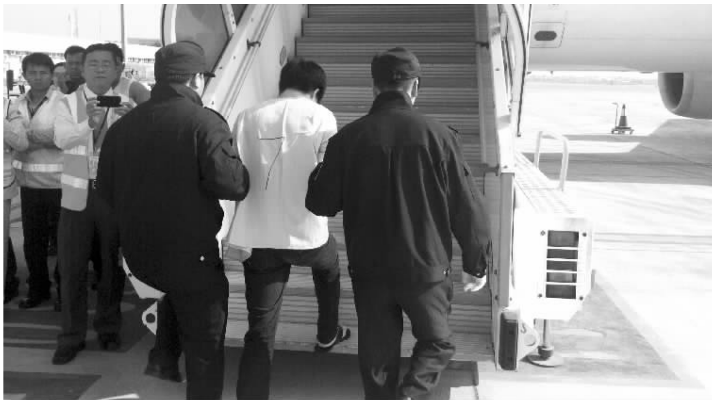
在民警的押送下,犯罪嫌疑人登上飞机。