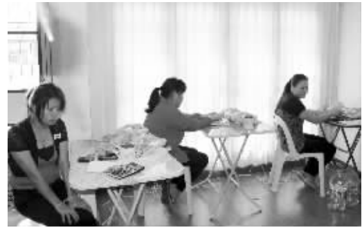
“公检法”就是这样产生的