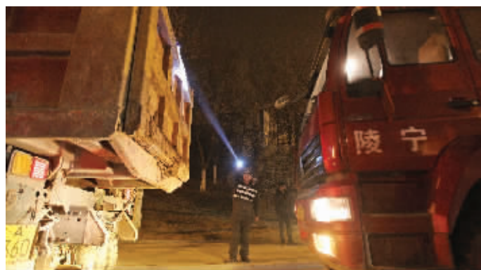
夜查渣土车

继南京市渣土办开展了多次零点整治后,1月16日晚上10点开始,南京又开展了南京南站地区渣土运输巡查整治。现代快报记者跟随执法人员巡查发现,在15日《关于停止办理南京南站地区渣土清运准运证的通知》禁令下,南站全面停止渣土运输。但在随后的各区突击检查中,发现黑车运输渣土仍然跑得欢,还有渣土车不密闭,不设引导车,甚至有渣土车贴上别家公司名称,“全裸式”跑得欢。