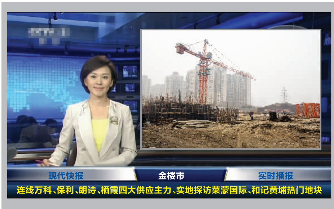
以上视频截图纯属PS,请勿对号入座。小图为莱蒙国际水榭春天工地近况