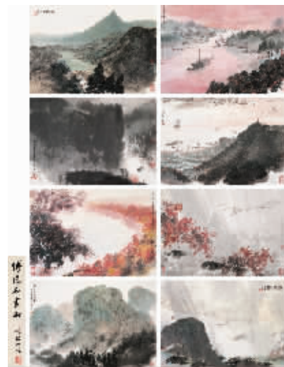
傅抱石《毛主席诗意图册页》

“新金陵画派”同样也是中国画市场上表现较为活跃的板块。截至2012年12月底，在雅昌艺术网“近现代国画总成交额排行榜”上，画派“五大高手”傅抱石、钱松喦、宋文治、魏紫熙、亚明分别位居第4、16、25、35、40位。