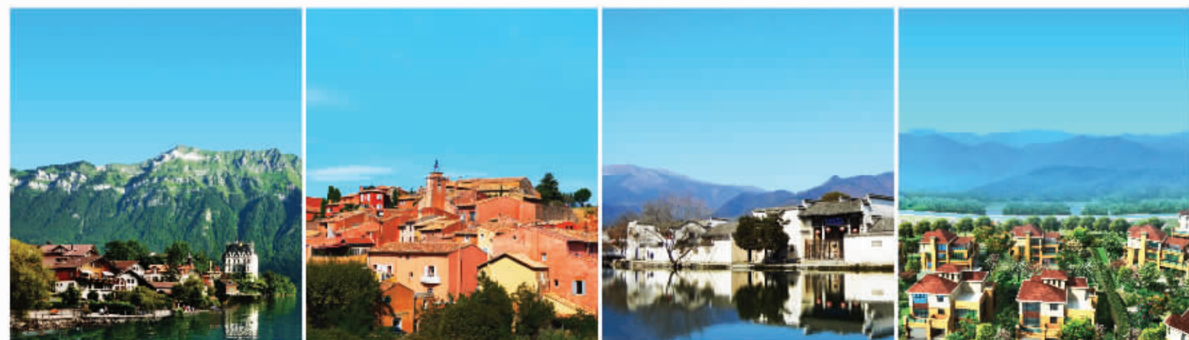
名称：凤凰水城 年份：约公元2008年 地址：江苏·南京东郊宝华山西麓