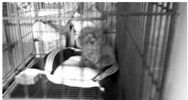
住单间,还有软垫子

快报讯(见习记者余乐)春节临近,很多人都发愁:自己要回老家,却不愿将狗寄养在一般的宠物店里。现在不用担心啦,把你“心爱的它”送进宠物幼儿园吧!