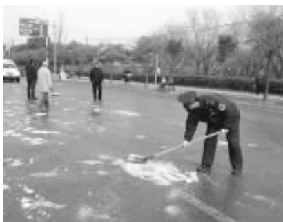
城管队员撒盐化冰

昨天清晨,因为冲洗渣土的水结了冰,凤凰西街的一处工地门口也成了“溜冰场”。一辆18路公交车发生了追尾,前挡风玻璃碎了一大半,还好没有人受伤。交警赶到后,立即疏导交通,城管队员不停向路面撒盐,同时用铁锹将一些积雪砸碎清除。