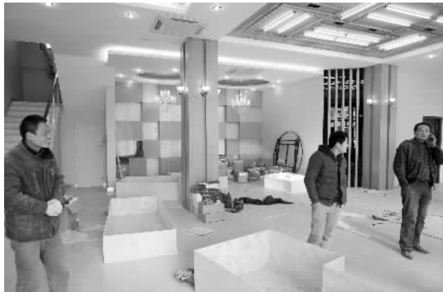
垃圾中转站配套用房已经开始装修