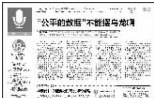
昨日社评版面图中还有一词应加引号, 那就是“更正”二字!