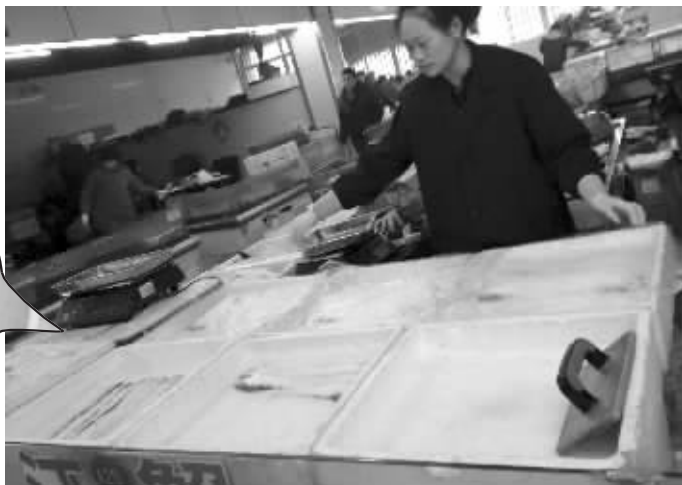
商户现在卖的海刀大多是“海刀”和“湖刀”