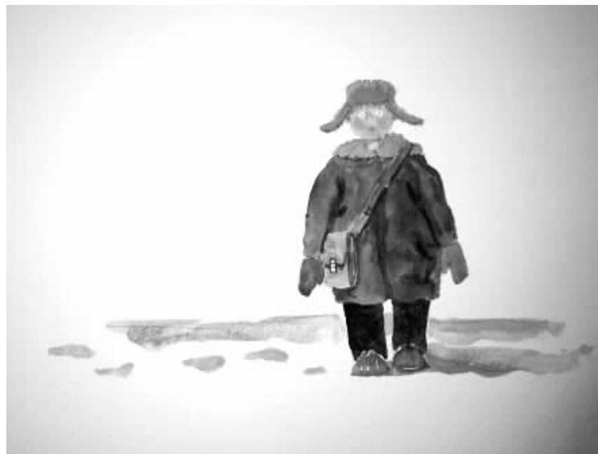
绘图/海角情人 插画师 美国 SND 插图奖获得者

“微博控”的夫妻日常聊天话题,70%以上都来自微博里的新闻和小道消息。每天,两人会互相“@”N条有趣的微博。双方通过微博对对方的社会资源有所了解。夫妻俩随时通过微博了解对方的行踪。