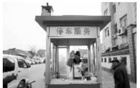
董师傅描述玻璃被砸的经过

“这是违停,你为啥不告诉我一声?罚钱事小,说不定还要扣分!”见和交警理论不赢,车