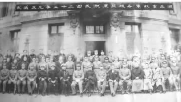
1934年元旦湖北军政机关合影照。此时,过元旦节已蔚然成风 资料图片

几乎推行到全国各地,成为教育界的一大特色。学校的庆贺活动不仅影响到学生和家,也影响到了社会。学校采用花样繁多的娱乐节目庆祝元旦,对来宾很有吸引力。渐渐地,各行各业的庆贺活动也都演变为以娱乐性为主。