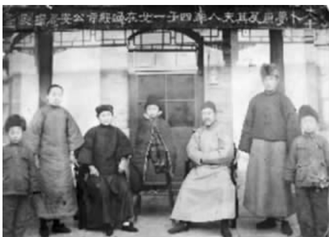
1929年元旦,某官员携家小拍全家福。当时,中上层国人流行过元旦节 资料图片