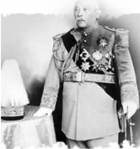
袁世凯担任大总统期间,每年元旦都举行隆重的庆典 资料图片