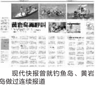
现代快报曾就钓鱼岛、黄岩岛做过连续报道