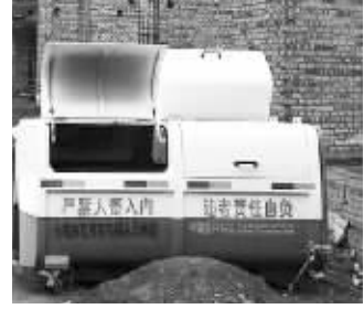
流浪儿童死亡事件后,贵州毕节垃圾桶上的标语再次成为舆论焦点