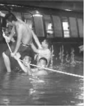
消防队员和志愿者营救乘客