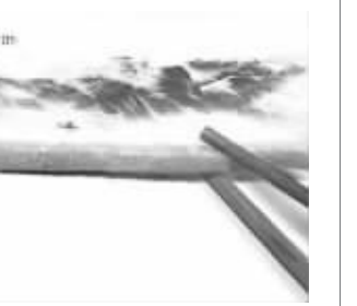
流浪儿童死亡事件后,贵州毕节垃圾桶上的标语再次成为舆论焦点

有人总结道:《舌尖上的中国》诉诸真诚的態度,真实的力量。反观当下许多作品,高投入、高科技、大场面……什么都不缺,唯独真实;什么都尽心尽力,唯独真诚。