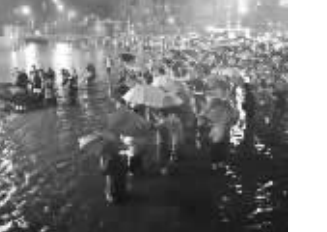
市民自发帮忙拖车

分辨一个国家是否发达,下一场三个小时的大雨足矣(龙应台语)。而据说是法国作家雨果的一句话(“下水道是城市的良心”),也成了一段时间里在网上被引用最多的名言。暴雨就是中国城市下水道的最好质检员,中国城市,上半身基本上很靓,下半身基本上很脏,每年,去北京、广州、成都、武汉、南昌、太原、郑州“看海”都会成为人们一种心酸自嘲。