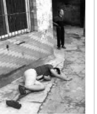
有人模仿周克华被击毙的姿势

八年时间,每当长沙、南京发生做案手法相同的案件,总会牵动大家的神经,大家总是在猜测,这个游荡的幽灵到底是谁。犹如轮回,八年后,周克华倒在了离他出生地仅30分钟车程的一条小巷子里。