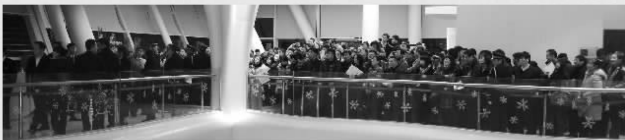
这么多人都是来买房的