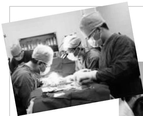
▲患者正接受手术的规范治疗