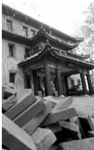
修缮材料已经进场