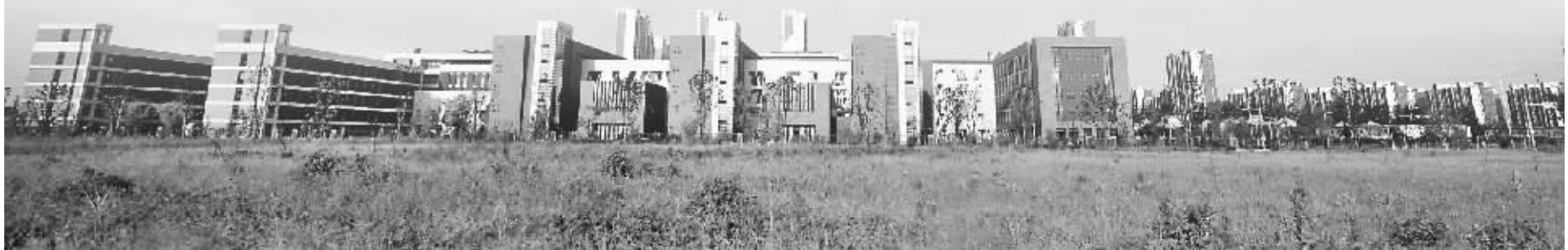
天一实验学校外景