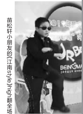
苗松轩小朋友的《江南style》high翻全场