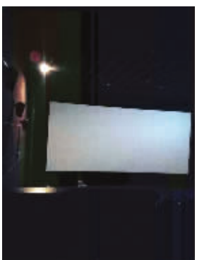
@小肆_秀秀:是有多倒霉啊!看个电影看到一半,说新街口全部停电,重启,早知道逛商场啦。