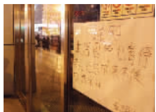
商家贴出了通知

昨晚9点半左右,南京供电部门通报消息称,停电发生在当晚18时59分,担负新街口时尚莱迪广场、工人文化宫、正洪商城供电的10千伏人防1号、2号线同时跳闸。南京供电公司应急抢修人员及应急发电车迅速赶赴现场,抢修恢复供电。经南京供电公司抢修人员全力查找故障,确定为一家户地下室渗水造成电器设备短路所致。目前,南京供电公司正在全力抢修,至发稿时已全部恢复正常供电。