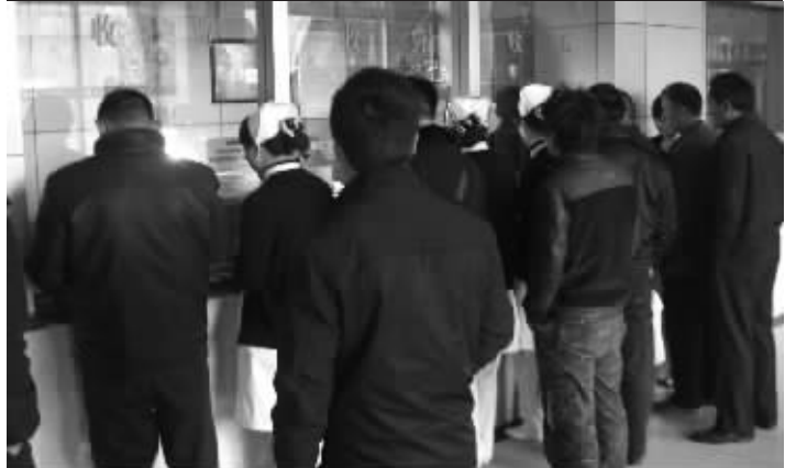
近期,不少男性来到南京建国男科医院“盘点”健康

有人说,男人像一部车,一个零部件出了问题,整体操控就不顺手。其实男人如车,如果前列腺、生殖器、泌尿系统、生殖系统中的任何一部分出了问题,都会让男人感到身体不受控制,影响生活和工作。男人是社会的中流砥柱,同时也是家庭的核心,辛苦工作的同时千万别忘了关注自身健康,至少一年做一次男科检查,随时监测泌尿生殖健康。在这个忙碌的年末,不妨挤出点时间,到专业男科医院给身体做一个全面检查,了解自身的健康状况的同时,还可以发现早期疾病信号,及时将其扼杀在萌芽状态,这样才能在来年的工作和生活中动力依旧。