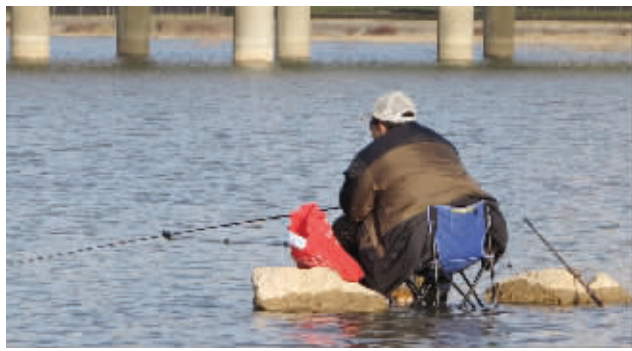
“孤舟蓑笠翁,独钓寒江雪”,寒冬时节还“下水”钓鱼。男人对钓鱼的热爱,也让女人捉摸不透。