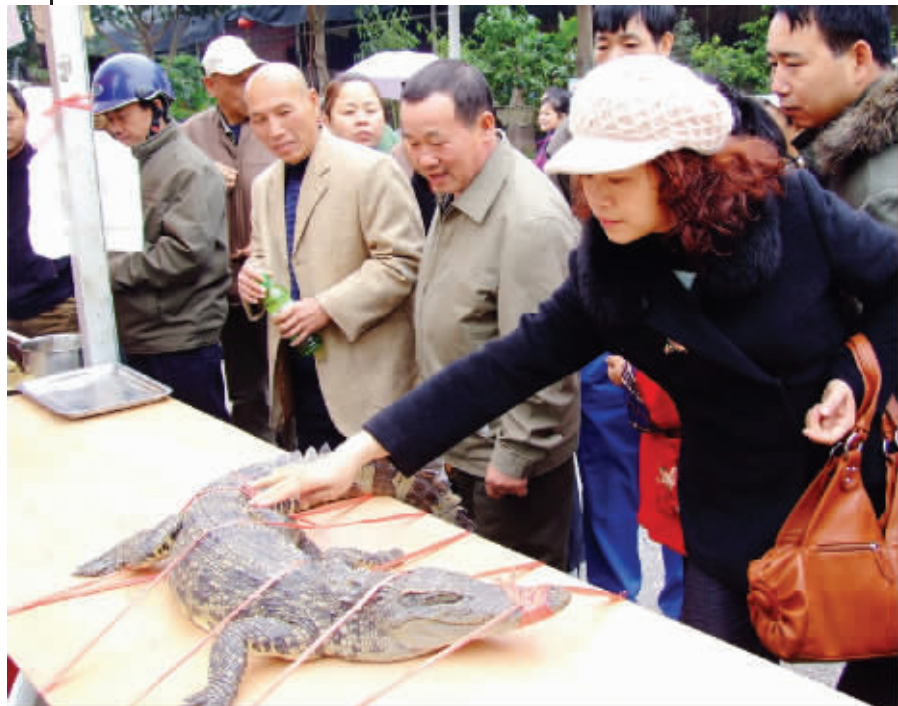
只有这位女士敢上前摸一摸,男人们都躲得远远的。看来,女人对皮具的热爱,是男人所不能理解的,“好大的鳄鱼皮钱包啊!”12月20日摄