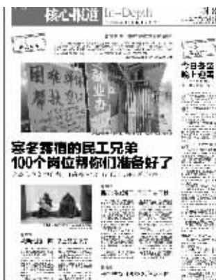
现代快报21日的报道

为了省钱,民工蜷缩在纬八路高架桥下睡觉,公安、城管、民政等部门上街救助,劝他们去救助站避寒,但是绝大多数人都摇头拒绝,因为救助站太远,他们想找工作。上周五,南京市人社局特地在安德门民工市场开设帮扶窗口,拿出100个包吃包住的岗位,免费送给这些就业困难民工。三天下来,有多少民工去应聘?昨天,现代快报记者回访时发现,一边是100个岗位原封不动,一个都没送出去;一边是大龄民工依旧喊,找工作难。