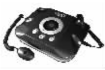
光科超聚能前列腺治疗仪