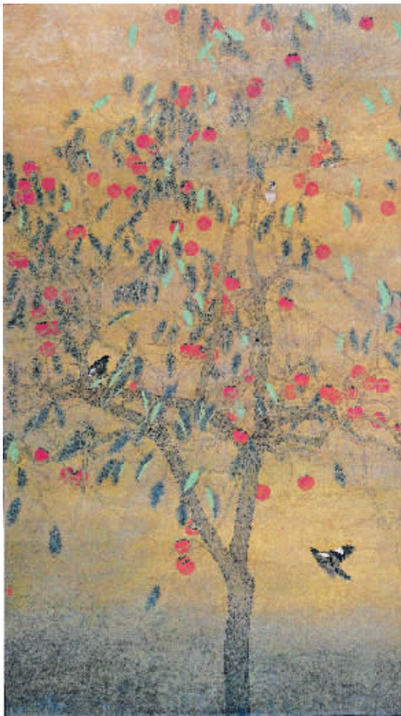
张永军《满枝硕果耀深》