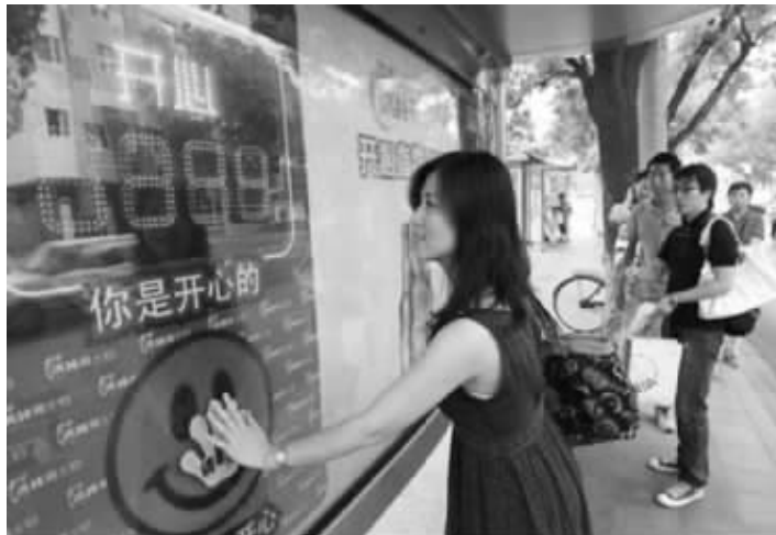
北京闹市公交站点收集开心指数 (资料图片)