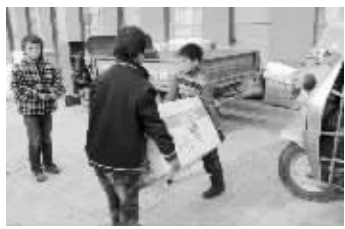
孩子们帮忙搬运包裹