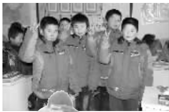
▲教室里,孩子们都穿上了新衣服