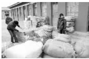
第一批爱心衣物,前天下午到达学校