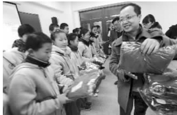
12月21日,现代快报联合江苏广电好享购物、江苏省红十字会,给南京沙洲中学学生送去458套保暖内衣

“年底正是生产、销售保暖内衣的旺季,但好享购物作为全国领先的电视购物企业,更要有领先的社会责任感和公益意识。所以我们协调厂商加急生产了1000套保暖内衣,作为此次年底送温暖系列活动的物品。”向俊波还介绍说,好享购物还将在新年启动新一轮爱心活动,“2013年1月1日-3日,大家在好享购物电视或网上商城(www.hao24.cn)每购买1件商品,我们将捐出1元,用于购买暖冬物品,送给快报读者捐建的远景小学、安徽顺河小学的学生。”