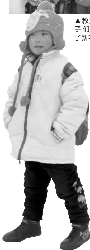
学前班的孩子小田从头到脚都是新的

在富登融保爱心影响下,富登融保的客户常州普嘉贝尔服饰有限公司表示,以成本价提供儿童羽绒服给富登融保,另外又赠送了富登融保购买数量的20%,一起为孩子们奉献爱心。