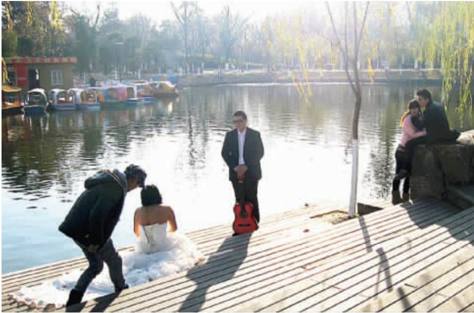
冬天拍婚纱照,太冷了。准新娘美丽“冻人”,让旁边的姑娘看得十分感“冻”,紧紧地靠在了男朋友怀里。12月9日摄 (作者钱先生获30元话费)