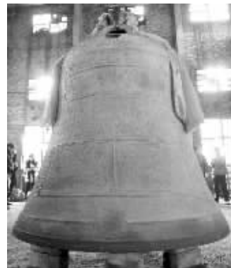
复制的清乾隆铜钟

浑厚的钟声,在南钢的厂房里传出来。昨天,为拉萨关帝庙复制的“清乾隆铜钟”起运拉萨。