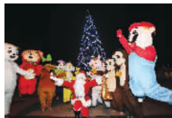
圣诞树点亮

快报讯(记者 张瑜)在雪地欣赏漂亮的圣诞树，收圣诞老人的神秘礼物，通过圣诞邮局寄送祝福明信片……这些平时在电影中才能看到的场景即将走到南京市民身边。昨晚，河西滨江公园环球缤纷嘉年华高18米的圣诞树点亮，今天上午，圣诞村正式开园迎客。本次圣诞村开放到明年1月13日，各种吃喝玩乐项目，让你不出南京也能过一个原汁原味的北欧圣诞节。