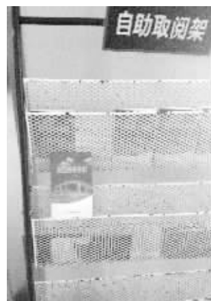
公安局出入境办证大厅内的《出国劳务必读》

时间里,一直没有人到商务局反映过此事,百姓缺乏防范意识也是骗子得逞的一个重要因素。