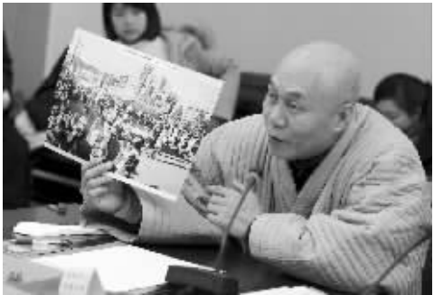
—韩国和平人士捐赠史料

锅、肥皂盒、军用毛毯、手表、证书、日军士兵的随军日记……昨天，侵华日军南京大屠杀遇难同胞纪念馆（以下简称纪念馆）获赠46件珍贵文物，这些文物来自加拿大、美国、日本、韩国以及国内多地。 纪念馆馆长朱成山表示，新获赠的史料很有价值，以打字稿原件最为珍贵，它是外籍证人员茨在南京大屠杀期间记录的第一手实证资料。直接描述了侵华日军在南京进行大屠杀的罪行。据了解，目前南京大屠杀遇难同胞纪念馆现收藏各类藏品15万多件，其中文物达2.5万多件。