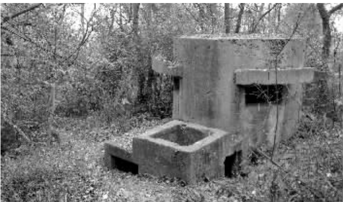
—隐藏在山中难以被人发现的民国碉堡

紫金山上有一批碉堡，建于民国。75年前的12月8日晨到12日深夜，侵华日军和守卫紫金山的中国军队展开激战。今年3月，“第四批南京市文物保护单位”名单公布，从范鸡仙墓旁上山，在丛林里看到一处碉堡遗址，碉堡为钢筋混凝土结构，圆柱形，高2米多，直径3米，有5个内外宽的射击孔。附近还找到一处碉堡，和一个营连指挥所遗址。人口已被土石堵住一半，弹痕遍布，其余保存完好。