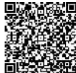
扫描二维码, 观看相关视频

我国海监船曾于2010年在钓鱼岛海域遭遇日方几十架次的巡逻飞机干扰。王晓鹏指出,通过近年来的类似执法事件,为应对日本方面的海洋巡逻机制,弥补自身短板,我国在相关海域采用立体巡航模式具有极大的必要性。此次将海监飞机加入巡航编队,也是一个必然的选择。在应对策略方面,日方对于钓鱼岛海域的所谓“执法管理”,是由日本海上保安厅的船只和巡逻机共同执行的。我方相应采取对等应对原则,同样需要建立起海空一体化的管理模式。