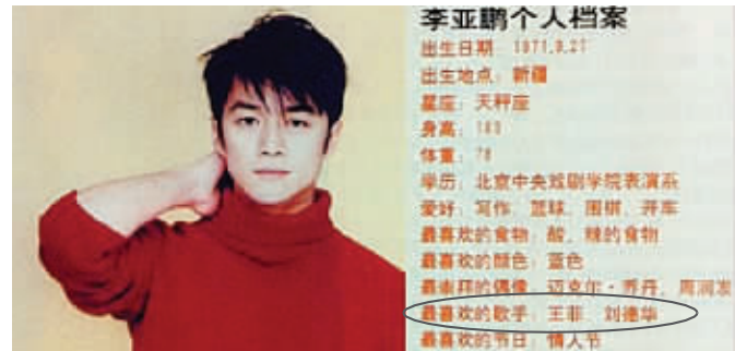
11年前,某杂志刊登的李亚鹏个人档案

近日,《上海壹周》专栏作者“月月熊”发微博说,偶然在一本11年前的杂志上发现李亚鹏的专访,文章内容很普通,但里面的“个人档案”却亮点十足:当年李亚鹏最喜欢的歌手是王菲和刘德华!这条微博引来上万网友围观,李亚鹏成了大家眼里最牛的“励志哥”,他自己却调侃这条旧闻是“英雄怕见老街坊”。