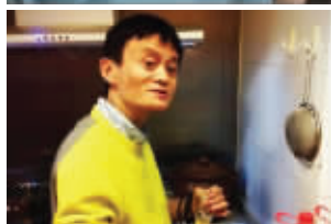
“毛衣控”马云的各式毛衣