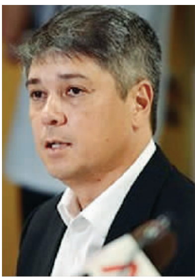
刚辞职的新加坡国会议长柏默