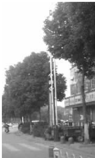
遮挡信号灯的树枝已被修剪

这位负责人建议,司机经过路口时,无论有没有信号灯,都应该减速,仔细观察,这样就不会有误闯红灯的情况。